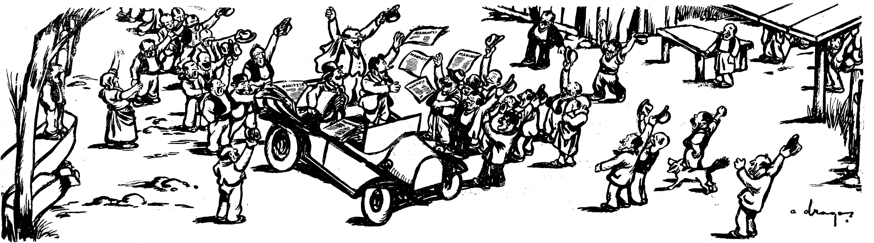
CAMPANIA ELECTORALA IN MAI 1931. — „Fraților, vă rog să-mi dați mie voturile, dacă listele de candidaturi vor fi gata până la alegeri și dacă s'o întâmplă să fii și eu pe listă...”