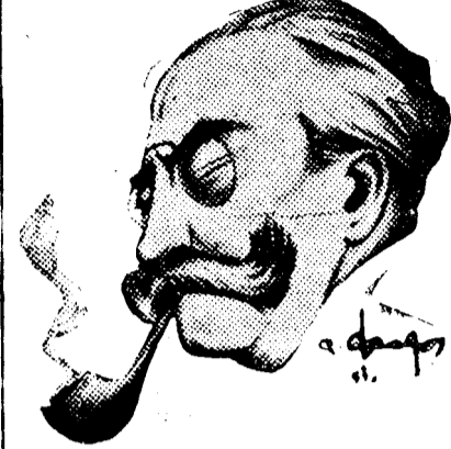
D. AL. VAIDA-VOEVD