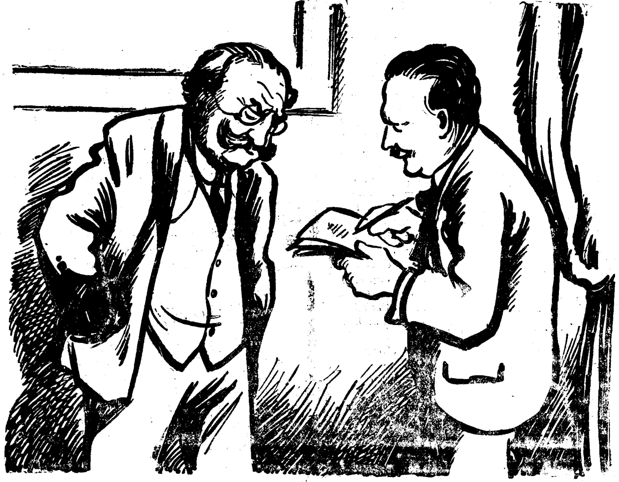
— Și-acuma ce faceți, d-le Vaida? — Mai întrebă? Plec la Viena, la sanatoriu!...