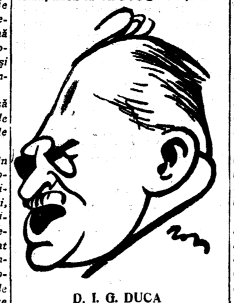
D. I. G. DUCA

În numele Partidului Național Liberal Președinte, I. G. DUCA