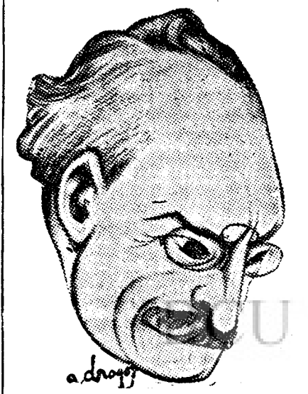
D. I. G. DUCA

După cum se vede, două teze fundamentale opuse. Semnificativ și prevestitor de o acomodare, apărea însă de înțeles faptul că și apărătorii primei teze și cei ai celeilalte pledau în interesul formării guvernului de concentrare