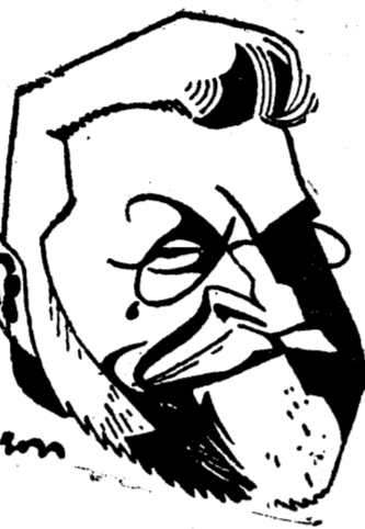
D. VINTILA BRATIANU

In primul rând guvernul studiază măsurile potrivite pentru tempera-