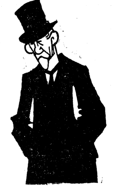
D. GEN. AVERESCU

Guvernul are de rezolvat pe lângă preocupările de guvernământ obișnuite, două probleme politice care reclamă o grabnică deslegare. Fixarea candidaturilor la alegerile partiale din Basarabia și mutările proiectate în administrația acestei provincii, impun un deosebit tact dat fiind starea de spirit a ba-