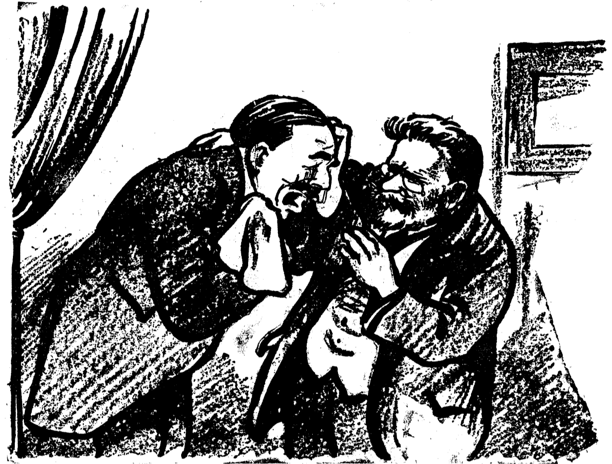
TARFA TANCRUD: Șefule, auți că vor să mă bage la puscărie! D. VINTILA BRĂTIANU, Lasă, nu mă plînge, nu-i nimic! Cătușele nu rod prea rău pe cei cu mîni lungi!