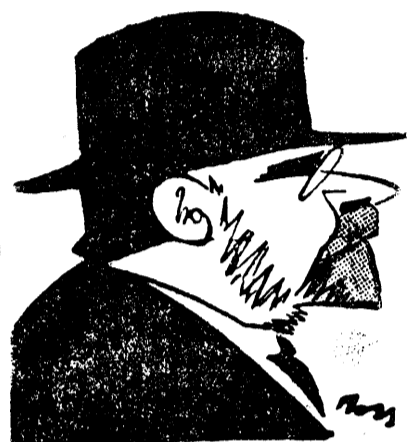
D. VINTILĂ BRĂTIANU

În afară de lucrările anunțate se va procedea la reorganizarea și modernizarea armamentului.