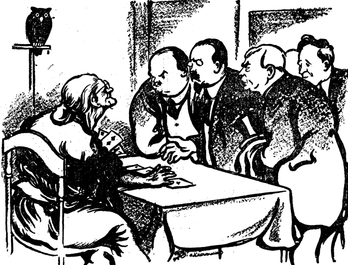
Cum iese, nu iese bine, voinței babel... Se face că vă trimete la vatră pe toți câți sunteți aici...