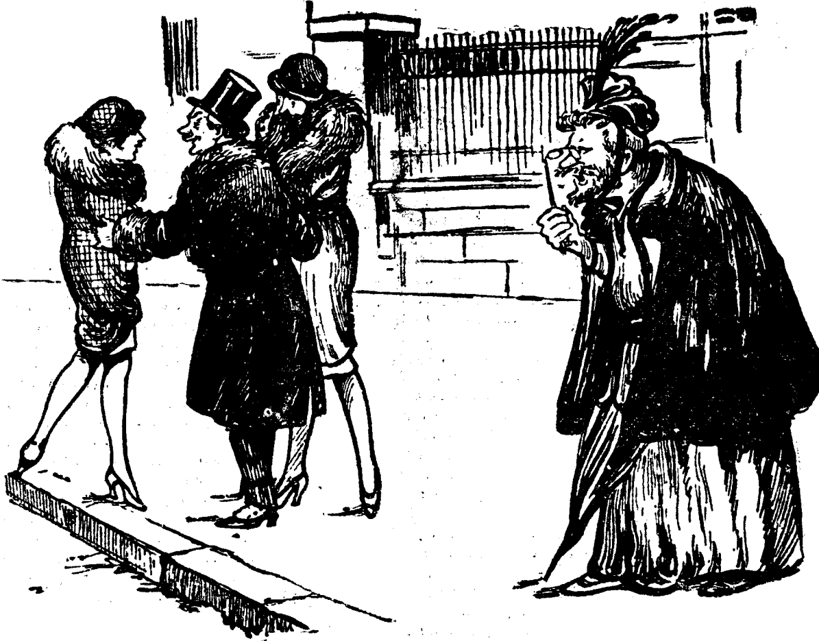
BABA VINTILA. — Eu sunt prea cinstită ca să mă țin de crali.