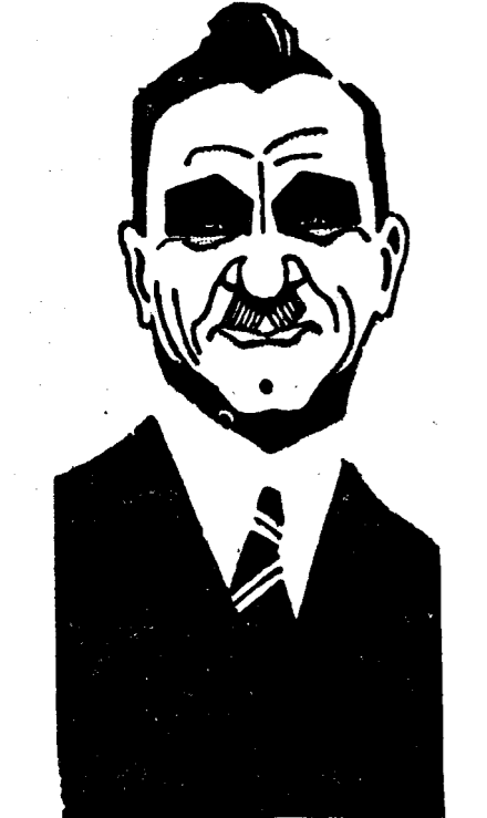
D. IULIU MANIU

„Alegerile generale au dat dovada nu numai de popularitatea partidului național-țărănesc dar și de completa maturitate politică a poporului românesc.