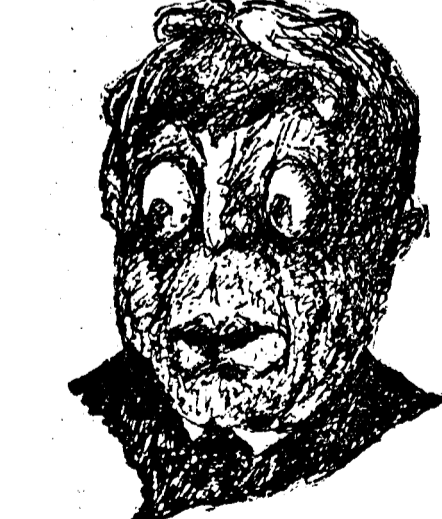
D. OCTAVIAN GOGA

În unele cercuri politice se afirmă că d. general Averescu are intenția să părăsească președinția activă a partidului poporului, cedând-o d-lui Octavian Goga.