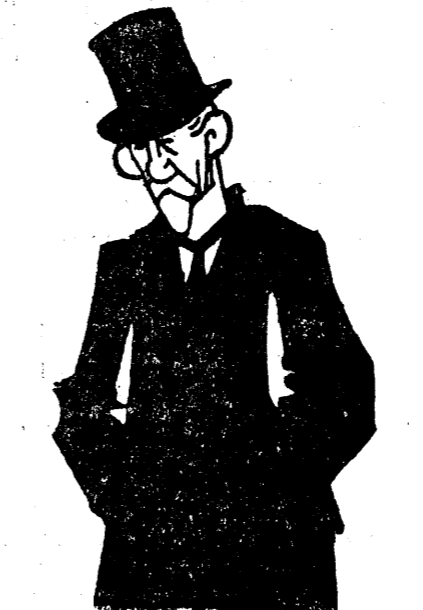
D. GEN. AVERESCU

Deci un prim punct stabilit: nici un ban din acest împrumut nu vine în țară. Speranța — speranța d-lui Vintilă Brătianu — e că, odată leul stabilit, capitalurile străine vor aflua spre piața noastră străină. Rămâne de văzut dacă aces-