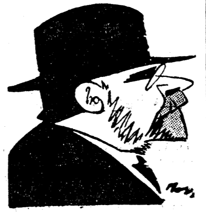
D-l V. BRĂTIANU

Ne împrumutăm — așa cum am anunțat noi, încă de acum o lună, când tratativele erau în