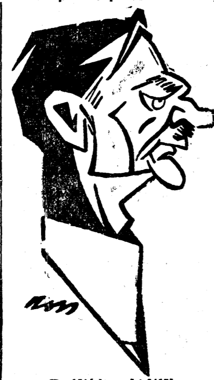
D. IULIU MANIU