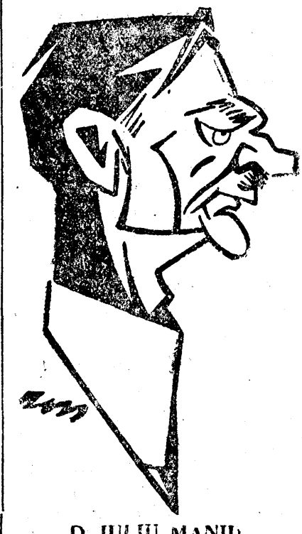
D. IULIU MANIU

«Oricum ar vrea să o ascundă cei interesați, stăm în fața unei crize de guvern, poate latentă încă în momentul acesta, dar care va deveni pe față și acută în cel mai scurt timp”.