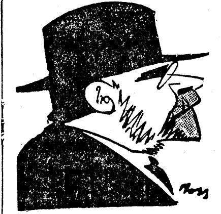
D-I V. BRĂTIANU

„D. V. Brătianu mărturisește că a fost învitat să plece. Noi îl sfătuim să n'astepte să fie somat și să plece cât mai este cu cinste.