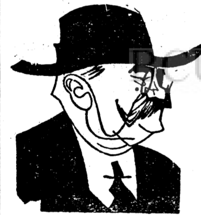
D. VAIDA VOIEVOD

clusiv legale, și a mers pe căile politice. „Dacă factorul constituțional nu va putea să-și ia rolul de arbitru și nu va aviza, el însuși va da indicația, că trebuie să fie eliberat și prin aceasta se va fi decretat inutilitatea oricărui mijloc politic