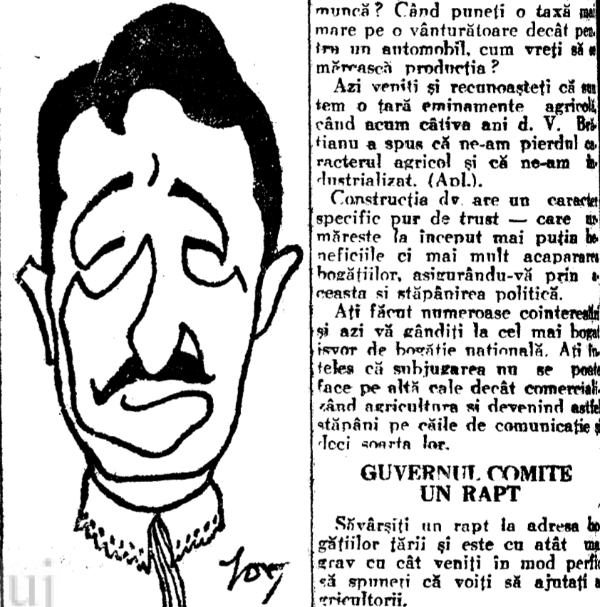
D. ION MIHALACHE

D. Chamberlain a sosit la Paris Paris, 3 (Rador). - D. Chamberlain a sosit azi după amiază la Paris. Imediat după sosire a avut o lungă întrevvedere cu d. Briand apoi a primit pe ambasadorul Spaniei, care i-a comunicat textul acordului realizat în privința Tangerului și a anunțat apropiata revenire a Spaniei la Liga Națiunilor