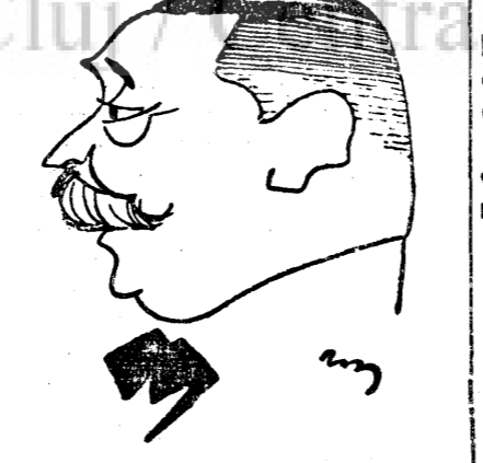
D. AL. IONESCU-TRAMWAY

Ruperea Europei în două nu poate fi posibilă mai multă vreme pe tărâm economic. Veacul al XIX cu introducerea treptată a regimului burgez-capitalist în statele europene a avut ca rezultat o cooperare strânsă, o interdependență economică, care nu poate fi zdrobită din motive politice. Din clipa în care Petru cel Mare s'a hotărât să modernizeze împărăția rusească, soarta apu-