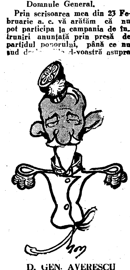
D. GEN. AVERESCU

modului cum se vor face alegerile viitoare pentru parlament; convingerea mea fiind, că alegeri fără libertate nu le mai poate face pe viitor, în România, decât un dictator, pe care eu nu-l văd, sau chiar dacă l'aș vedea nu l'aș urma. Ori și ce încercare de a