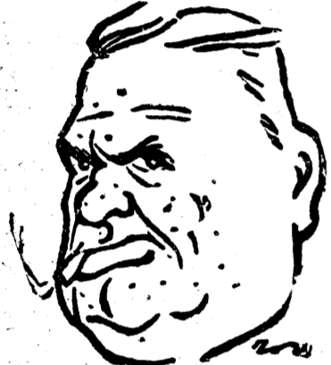
D. C. ARGETOIANU

La un moment dat, d. Argetoianu a declarat că, dacă opoziția în-nea să se ridice ședința, Camera n-va mai fiind în număr, nu se opune, dar cere să se facă și ședințe de noapte.