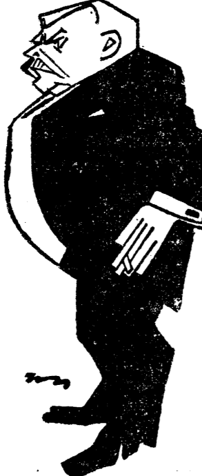
D. GHIȚĂ POPESCU