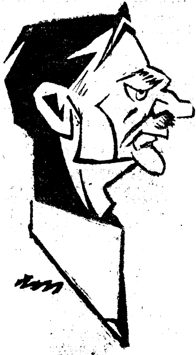
D. I. MANIU