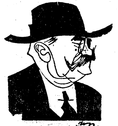
D. AL. VAIDA VOIEVOD