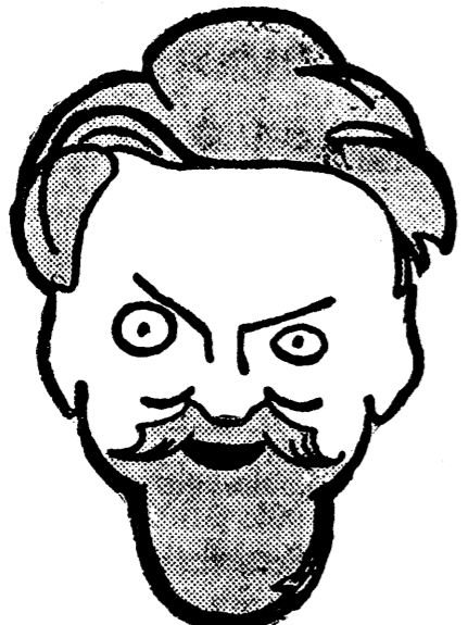
o dată pentru Lorrain și o dată pentru Bleriot.

Din scopul prezentei de încredere suntem informați că d. Fabre nu va participa la marele meeting al aviației noastre, meeting organizat de Aero-Clubul Regal al României.