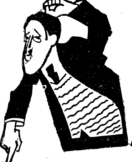
D. VIRGIL MADGEARU

„Ce mai gravă problemă pentru rezolvarea căreia partidul național-țărăniștii luptă de zece ani, continuă d. Madgearu, este consolidarea așezământului constituțional prin guvernării reprezentând poiziția națională exprimată în alegeri libere. Nu se poate asigura o administrație pusă exclusiv în interesul obștesc, nici o justiție independentă și nici o armată națională înzestrată cu tot utilajul modern și cu spiritul unității și disciplinei naționale câtă vreme toate aceste instituții fundamentale vor fi deviate dela rolul lor și în interesul falsificării alegerilor și terorizării populației a masselor populare. Condiția sine qua non pentru o normală funcționare a vieții constituționale este existența unui factor constituțional liber și neinfluențat în funcția sa de arbitru între forțele politice.