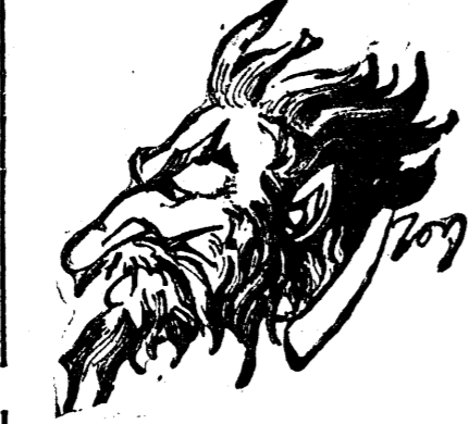
D. V. BRĂTIANU

din bugetul actual, anunțând că d-sea a luat personal măsuri, ca această măsură să fie cât mai strict aplicată. După calculele făcute în ședința de ieri bugetul general al