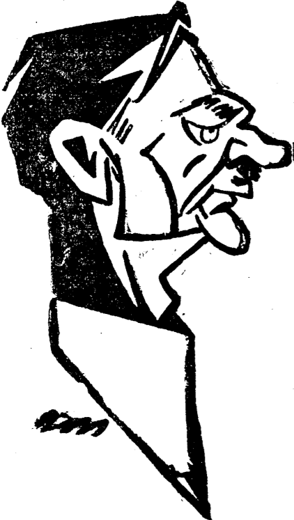
D. IULIU MANIU

Am anunțat în numărul nostru de ieri că d. Vintilă Brătianu, revenindu-și din perioada de deprimare ce-l cuprinsese la întoarcerea d-sale în țară, s'a hotărât să... nu se mai retragă de la guvern. Fie că încheie, fie că nu încheie împrumutul, convins că prezența d-sale la cîrmă Statului este imperios necesară țării, pe care primul-ministru ține dărz s'o ferească cu deasla, și mai departe.