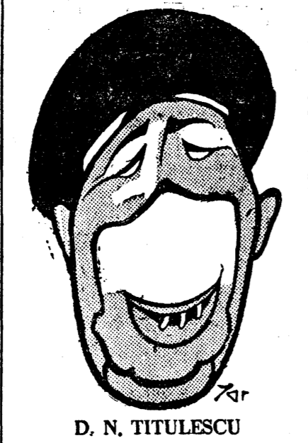
D. N. TITULESCU

„Ziarul german încearcă să prezinte opiniei publice gruparea Miciei Antante și în special pe d. Beneș, ca un obstacol serios la realizarea tendințelor germane în chestia Anchluss-ului și evacuării Renaniei. Evident că aceste probleme europene interesează politica Micii Antante, dar ar fi absurd să se creadă că cele trei state ar încerca să impună noul lor de vedere Aliaților. Dimpotrivă atitudinea Micii Înțelegeri este întotdeauna în acord cu politica marilor aliați care sunt primii și direct interesați la soluționarea acestor probleme.“