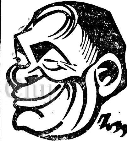
D. Ing. TEODORESCU

ceace privește cumpărarea biletelor, deoarece acestea urmează să se plătească exact după cursul oficial.