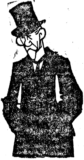
D. GEN. AVERESCU

„D. Vintilă Brătianu a fost protagonistul acestui program economic, așa că dacă stabilizarea nu reușește, d-sa rămâne la vechiul program...”