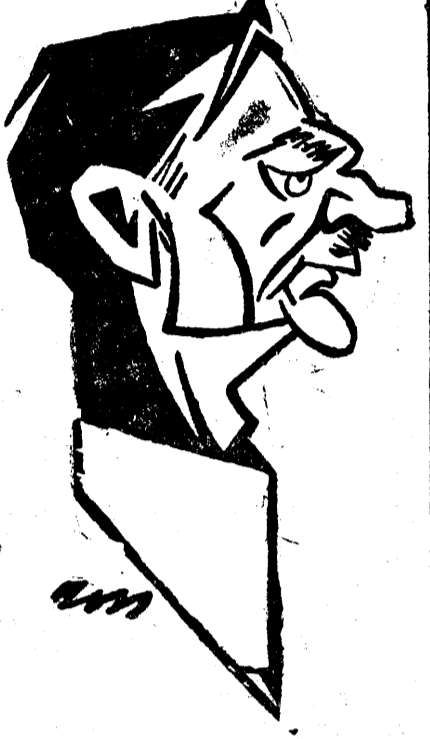
D. IULIU MANIU

«Ca și în preajma marilor manifestații vulcanice sau geologice, operațiunile financiare își au ele fenomenele lor: loviturile repezi de burșă, rezultate ale unor indischerii amabile... Cum a fost cazul personajului care, speculând în ultimele zile, acțiuni de-ale Băncii Naționale a agonisit, la Bursă, o bagadelă de 60 de milioane... în așteptarea miliardului».