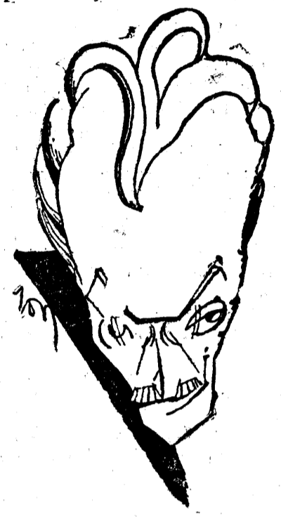
D. I. G. DUCA

Pretindea că e un partid de guvernământ înfruntând lupta contra regimului actual, deschis, curajos, fie în Parlament, fie în afara Parlamentului. Ce interes poate avea acum să lase să se acrediteze în opinia publică străină impresia că urmărește scopuri revoluționare, că preconizează ideea republicană și că nu se va da în