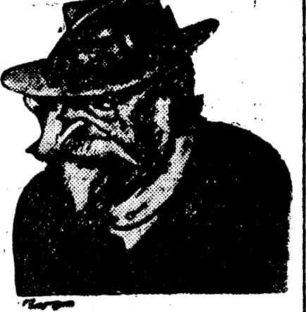
D. VINTILA BRATIANU

dacă realizează chiar împrumutul și stabilizarea — guvernul Vintilă Brătianu trebuie să se retragă.