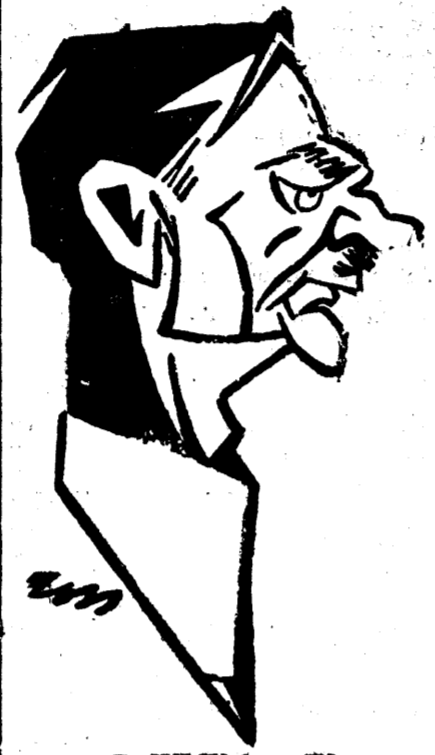
D. IULIU MANIU

curile oficiale chiar, cu tot optimismul d-lui Duca și cu toată încăpățănarea catărăcescă a d-lui Vintilă Brătianu, a început să se întrezărească posibilitatea unui apropiat — și, firește, fatal — desnodământ.