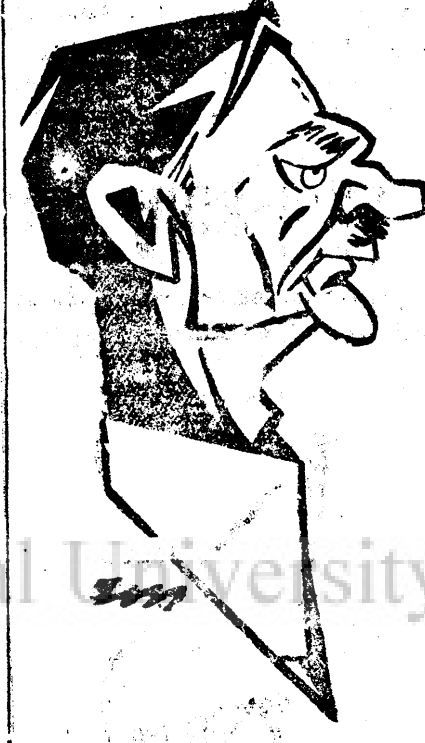
D. IULIU MANIU

Adunarea națională dela Alba-Iulia cere Inaltei Regențe demiterea guvernului, și numirea unui guvern național-țărănesc prezidat de d. Iuliu Maniu. Partidul național-țărănesc adresează aceste apeluri către Inalta Regență îndemnat de sentimentul monarhic, și spre a evita