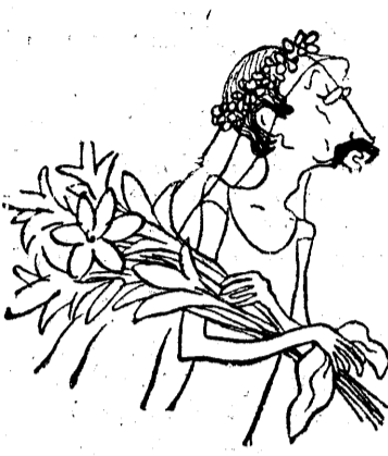
D. LEON BLUM

„L'Humanité”, oficiosul partidului comunist, adresează un apel socialistilor îndemnându-i ca la