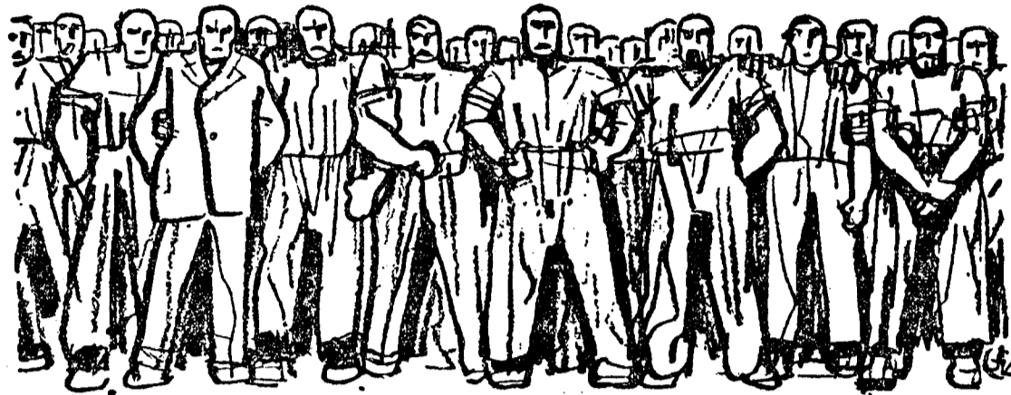
Front împotriva dictaturilor de dreapta și de stînga