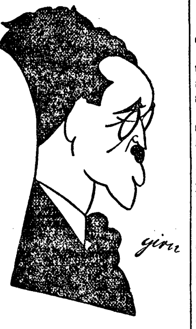
Dar nu, avem convingerea că în această țară și în măruntăile acestui popor se va mai găsi acea încordare conștientă, care să salveze viitorul acestui neam de pe marginea prăpastiei, unde l'au împins nechibzuința unora și ticăloșia criminală a altora.

Dacă nu am crede în virtuțile acestui neam și în reacțiunea ce fatal trebuie să izbucnească, atunci cu drept cuvânt v'am spune: "Ale tale, dintru ale tale, Israele", și am termina.