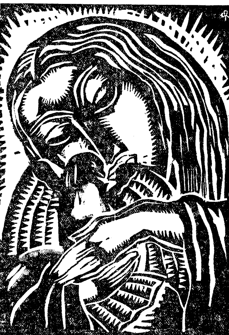
MAC CONSTANTINESCU Pictura cu Colomba