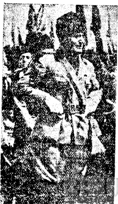
D. BENITO MUSSOLINI

Să nu se creadă că suntem așa de naivi ce să credem că între Italia, Austria și Ungaria există