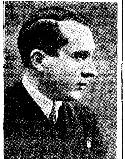
Romanele lui, ca și nuvelele, care nu sunt decât tot romane în embrion, sunt de natură psihologică. Sufletul eroilor săi este descisec până în străfunduri. Nu este însă nici balzacian, nici dostoevskian, ci original. Eroii săi nu reprezintă cazuri morbide ci viață autentică. Opera lui e plină de dinamism și căta poezie totuși, se strecoară printre rânduri! Sufletul autorului era înțajat să călătorească prin spațiile interplanetare, călăuzit de lentila unei lunete. De colo își umpluse sufletul de mireasma nemărginirii și așterne vase paginile pline de sbuciumul cântării necunoscutului. Complexitatea simțurilor eroilor săi era însăși complexitatea gingașă a sufletului său: un adânc cunoscător de oameni, un aspru scrutător al caracterelor, un chirurg al subconștientului și în același timp un suav poet, a cărui poezie nu e din lumea aceasta.

■ GIB. I. MIHAESCU a trecut puțea spre țara veacurilor. A luat cu el o mare glorie și o mare speranță a literaturii noastre. În cele șapte volume publicate a lăsat însă, o viață veșnică, viață care va dura nu numai cât va dăinui limba românească, ci atât cât se va mai vorbi o limbă pe pământul acesta. Gib. I. Mihaescu este unul dintre puținii scriitori români, cari vor arăta lumii întregi complexitatea sufletului omeneșc, universal, căci eroii săi deși români, intră în universalitate prin înaltul sistem de înțelegere a celor mai ascunse cute ale sufletului lor.