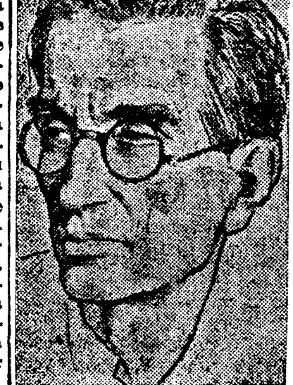
trati a lămurit de ce urăște comunismul și toate celelalte isme politice existente, potăle comuniste nu au conținut cu scheunăturile, făcînd tapaj, nu de dragul ideii în sine, ci doar de la o auză papa Stalin, ca să le trimetă nisealva ruble în zadar, Panaït Istrati a somat pe calomniator să lămurească cu fapte, acuzele. Răspunsul a fost sau de tăcere nepunătoare — sau venica placă: „haiducul Siguranței” ș. a.

Pentru că Panaït Istrati, ca orice om liber, s'a ridicat în țara lui împotriva teroarelor roșii, a lui împotriva veletăților sîrindariste de-a ne bolșeviza, au început să curgă împotriva lui „insulele și denunțurile de: fascist, antisemit, patriot, agent de Siguranță. În zadar, Panaït Istrati a lămurit de ce urăște comunismul și toate celelalte isme politice existente, potăle comuniste nu au conținut cu scheunăturile, făcînd tapaj, nu de dragul ideii în sine, ci doar de la o auză papa Stalin, ca să le trimetă nisealva ruble în zadar, Panaït Istrati a somat pe calomniator să lămurească cu fapte, acuzele. Răspunsul a fost sau de tăcere nepunătoare — sau venica placă: „haiducul Siguranței” ș. a.