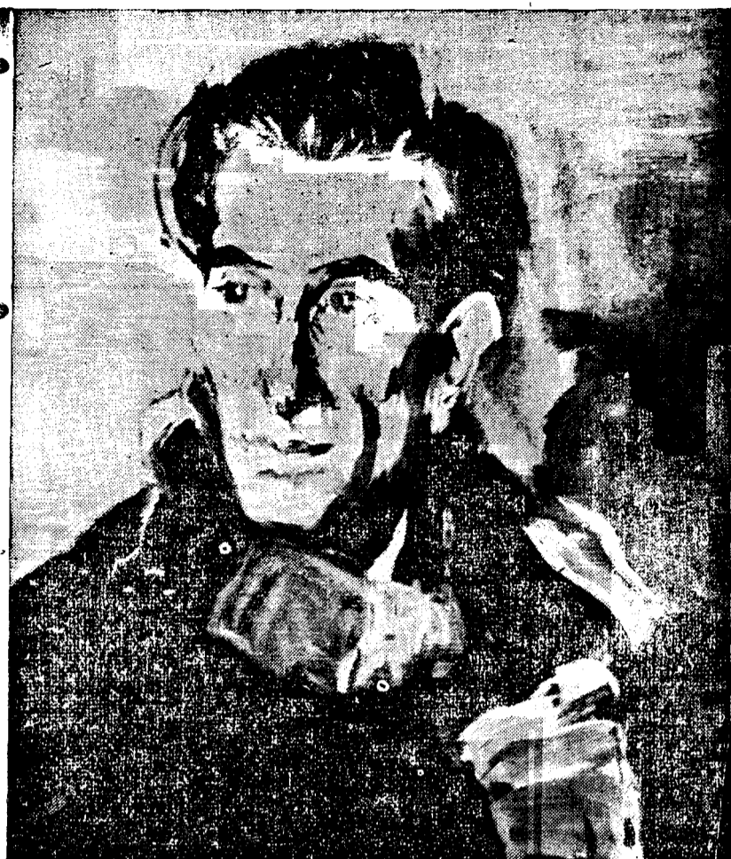
Panaït Istrati văzut de pictorul Stoenescu Pinx