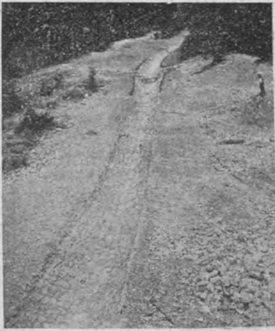
21. kép. Kővezett csatornával biztosított völgyelet.

könnyítheti nemcsak a mesterséges erdősítési munkálataknak, hanem a természetes felújulásnak végrehajtását is. A gyöngébb minőségű fenyőanyag még ha szúrágott és kissé vörös redves is, felhasználhatik papirlemezgyártásra; így itt az élelmes vállalkozó minden választékot kitünően értékesíthet. A jobb faanyag túlnyomólag a bécsi és trieszti piacokon kerül eladásra. Sajnos azonban, hogy az itteni gazdálkodási rendszer mellett a haszon oroszánrészre nem az erdőbirtokos, hanem a vállalkozó cég jövedelmeit szaporítja, tehát éppen az az eset áll fenn itt is, a mi a papi birtokokat nálunk is jellemzi.