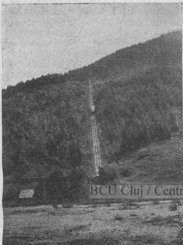
19. kép. Sikló Triebenben.

A vidék lakossága, melynek legnagyobb része szegénysorsú munkás, a vágások összes hulladékát elhordja és felhasználja, mely körülmény jelentékenyen meg-