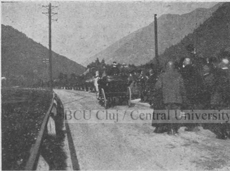
17. kép. Ő Felsége kocsija távozóban.

Nem láttam az erdősítésből sokat, de azt hiszem, hogy nem. Nem pedig azért, mivel itt a Triebenbach államköltségen eszközölt szabályozása előtt óriási pusztításokat vitt véghez, mely körülmény éppen ennek ellenkezőjéről tesz tanubizonyságot. Ez a vadpatak több kilométer hosszban nemcsak kő-fenekgátak egész sorozatával és szilárd kőpartokkal, hanem teljes fenékburkolattal is ellátott. Így ma már a letarolt hegyoldalokról lerohanó víztömeg csaknem teljesen kőhordalék nélkül