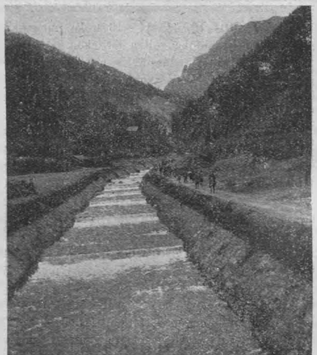
22. kép. A triebeni vadpatak alsó szakasza.

Útunk a fenséges Ens-szoros sziklás bércein keresztül az Eisenberg mellett vezetett át a Mura völgyébe, hol az egykori zúgó fenyvesek helyén ma a nap- és villanyfény mellett a dinamit hatalmas mennydörgésű robbanással bontja és rombolja az Alacsony Tauern hatalmas vasgerinceit. Az osztrák gyáripar itt bontakozik ki minden képzeletet meghaladó hatalmas méreteiben. A Donavitzi vasművek 260 hatalmas kéménye gőz- és füsttengerbe borítja az egész vidéket és az örökös köd üli meg innen elkezdve a Mura völgyét egész Leobenig.