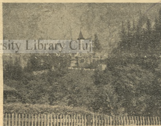
16. kép. Bajor hercegi vadászkastély a Leopoldsteinersee mellett.