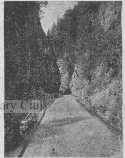
18. kép. Ebensee: Rindbachvölgyi erdei főút.