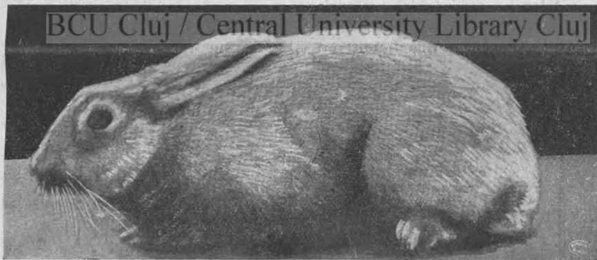
Sárga szőrme házinyul (nőstény).

szamócza tövet a drótféreg 700 darabra redukálta, a melyből 1905. évben még mintegy 100 darab ment tönkre. Ellenben a többi veteményes ágnál, a hol a gyeptakarót lehántottam és nem forgattam a föld alá, egyetlen egy növényem sem pusztult el. A burgonyaföldeken a drótférget százával találtam és pedig leginkább a még meglevő gyephantokban, vagy azok közelében. Sok burgonya úgy nézett ki, mintha madárseréttel lett volna átlövöldözve. Egy másik veteményes ágnál, a hol a gyeptakarót a föld alá vittem, elpusztult a növényzet fele: a gyökérfőt mindenütt átfúrta a drótféreg.