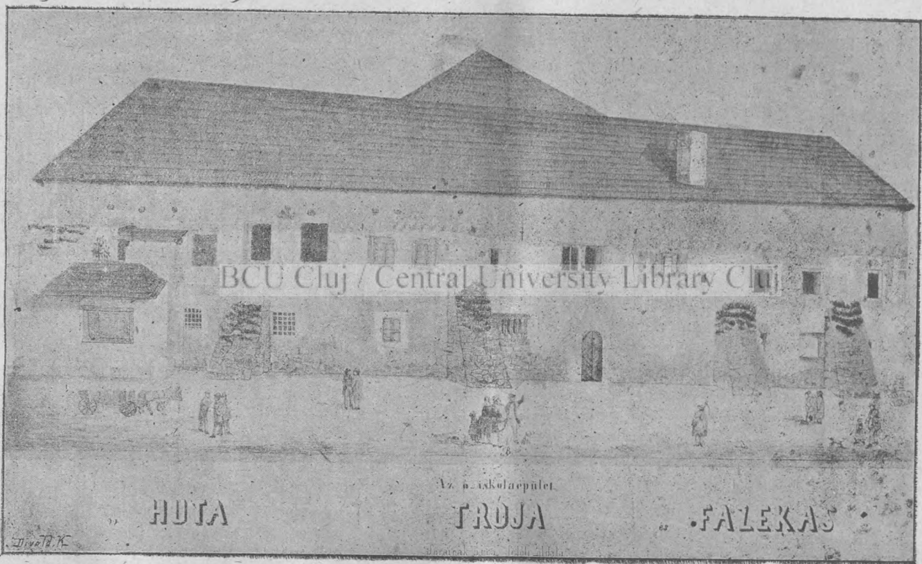
Sárospataki ó kollégium.

Másrészt nem kevésbé veszedelmes és bűnös dolog volna az emberek tetszését, bizonyosságát oly sóvárgással keresni, hogy közömbösek legyünk az Isten bizonyossága iránt. Pedig úgy látom, hogy a veszély különösen ezen az oldalon fenyeget. Nemde, kedves barátaim, az emberek dicsérete és helyeslése a ti életetekben jelentős tényezője a fejlődésnek, vagy visszaesésnek? Mikor tapsolnak, meg vagytok elégedve s mindent elkövettek, hogy tovább is rászolgájjatok e dicséretre. Ha hizelegve magasztalják kegyességeteket, ti azt egészen helőénvalónak találjátok.