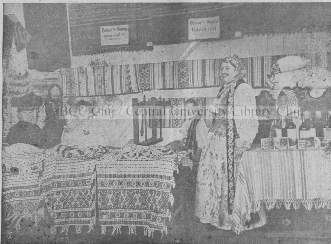
Kalotaszegi varroitas kiállítás.

Várjuk mi is szerényen, alázatosan azt, amit Isten ad. Hiszen a vendég nem parancsol, a bujdosó nem rendelkezik az idegen házában, hanem szerényen meghuzódik és bevárja az események folyását. Itt e földön Isten a házigazda, tehát ő rendelkezik, ő parancsol.