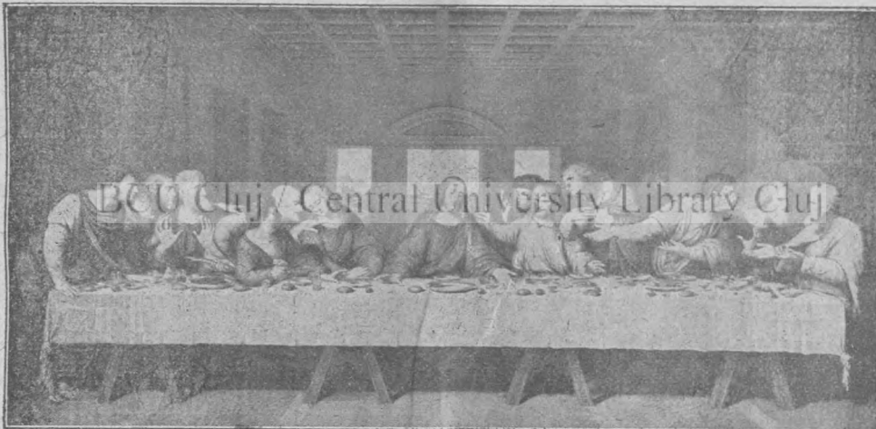
Leonardo da Vinci: Uri szent vacsora.