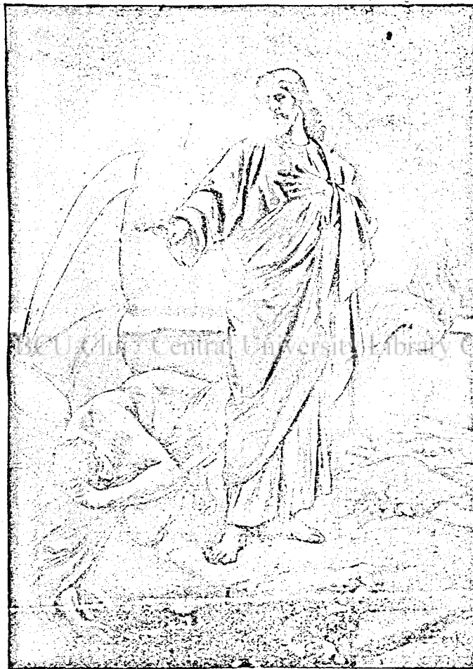
JÉZUS A PUSZTÁBAN.

Ott van, a hol ti éltek; a munkában, melyet naponkint elvégeztek; az örömben, mely szíveteket dagasztja; a jó, a nemes cselekedetek