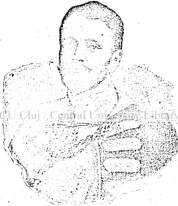
Gróf ANDRÁSSY GYULA

Minden lélek egy köve az Istenországa épületének. Szegelet kövé tenni minden lelket a legnemesebb feladat. Feltárni mindenki előtt az utat a boldogsághoz, a harczmezőt megmutatni min az idvesség harcza harczoltatik. Ennek sokféle utja jelöltetik meg. Megépíteni mint Omri Samaodát a mi boldogságunk Edenét, felékesíteni hittel, mint Akhab elefántcsonttal építé meg palotáját, a mi lelkünket erőssé tenni, mint Dávid építé erősnek Milót és bevégezni egész a tökéletességig — a mint az Ur ténplomát Salamon — a mi hitünk templomát is. Ez az építés módja.