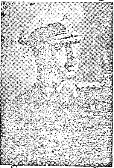
M. S. Regele CAROL II-lea

Programul, pe care Domnul Președinte al Consiliului l-a înfățișat în astă seară, este o promisiune cât se poate de frumoasă și fac din tot sufletul Meu