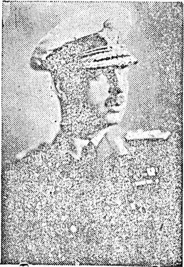
M. S. Regele CAROL II.

Cât de departe ni se pare timpul când, preocupate de mărunte interese de partid, guvernele politice de odinioară lăsau să treacă anii, fără să a-rate nici o grijă întăririi armatei. Mai