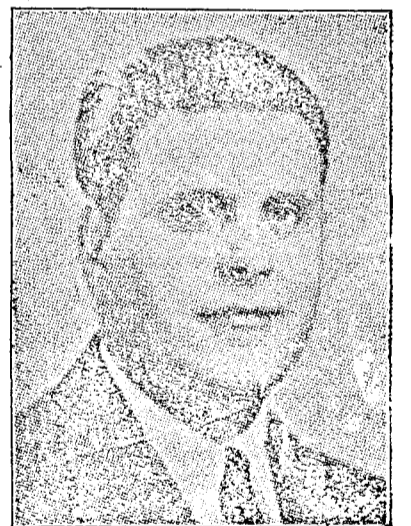
D-l Prof. N. Cornățeanu Ministru Agriculturii

Pentru realizarea planului economic, se prevede: 1) Continuitate și unitate, adică prin măsuri legislative și comandament unlc. 2) Respectarea contractelor și circulația bunurilor, prin desființarea dispozițiilor legale care îngreuiază circulația bunurilor și aplicarea unei proceduri menită să creeze o tradiție în respectarea obligațiilor luate. 3) Capital național și străin; să se ocrotească munca și capitalul național. Iar pentru dezvoltarea producției naționale este necesară colaborarea capitalului străin, care și el să aibă dreptul la protecțiunea Statului și la legitima sa remunerare. 4) Codul economiei naționale. 5) Reorganizarea aparatului (de