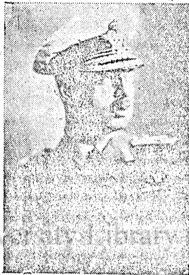
M. S. REGELE CAROL II

A fost o vreme când, pentru progresele civilizației, trebuia să privim peste granițele țării. Astăzi această vreme a trecut. Fără să disprețuim înfăptuirile făcute de alții, trebuie să ne fâlim cu ceea ce producem noi, atât pe terenul spiritual, cât și pe cel material.