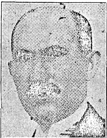
d. Prof. Dr. Gh. I. Sisești Ministrul Agriculturii

Din realizările minist. Agriculturii, condus cu atâta competență de cel mai strălucit agronom al Țării, d-l prof. Gh. Ionescu Sisești, putem cita câteva: 1) Concursul grâului 1938, care a trezit în toate unghiurile țării un interes deosebit și un înviorător entuziasm plugăresc. A fost o adevărată bătălie