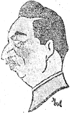
M. S. Regele Carol II

Ne găsim într-o situație excepțională. Conflictul internațional: războiul Italo-Abisinian și mai ales ocuparea Renaniei de către Germania, prin denunțarea tratatului dela Locarno, au făcut ca inima națiunii să bată cu o deosebită îngrijorare. Se