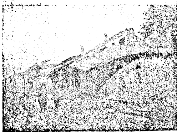
O stradă din Siliștra

Aspectul demografic extrem de variat contribuie la originalitatea comunei. Pitoresc buchet de grai, obiceiuri și port; cochetăii genial combinat; rază solară trecută printr'o picătură de rouă. Ilderim cu fesul nereformat de Kemal pașa, poartă castronase de lapte fermentat în locul flintei, (cum e turcul, e și iaurtul), Bai Ganciu șade grav în piață