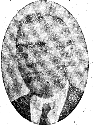
Dr. Profiriu Primarul orașului Siliștra

Nu este ușor să poți face să trăiască o foaie românească aici la noi; pentru aceasta conducerea „Semănătorul Român“ merită toată lauda, că a putut să arunce trei ani în șir, o sămânță cu rod bun pentru neamul nostru.