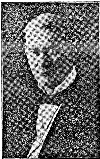
J. F. RUTHERFORD A Bibliatanulók Egyesületének elnöke

itt áll a föld egyik legesodálatosabb helyén és azon nagy dolgokról gondolkozik, melyeket itt hajtott végre az Isten. Valóban, mondhatjuk, hogy Palesztina az a hely, ahol Jehova az emberekre vonatkozó tervének legnagyobb részét felmutatta,—az a hely, ahol népe által évszázadokig példázatokat mutatott, működtetvén őket életteljesen, hogy megmutassa a jövőt és föltárja terve magyarázatát nagyobb arányban.