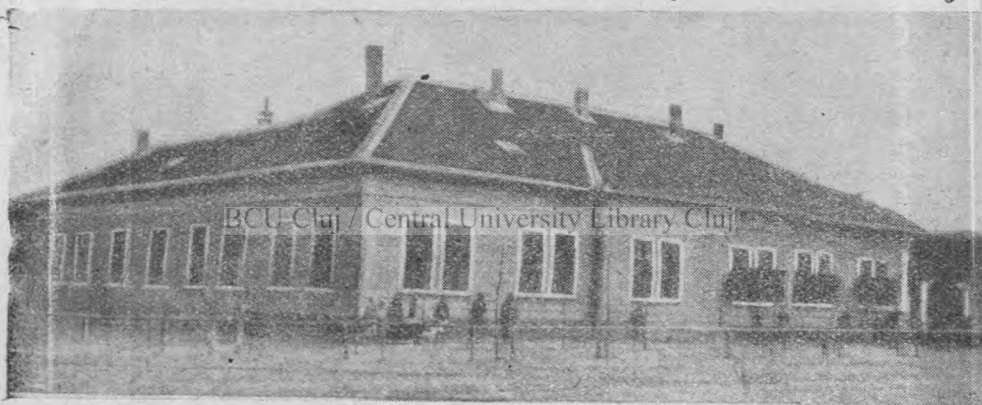
Primăria comunală Pesac.

Românii din Sânt Petru-Mare la 1333 aveau parohie or-