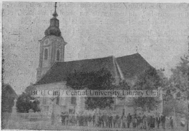
Biserica ortodoxă română. Monumentul Eroilor.

Forma bisericii este cea dreptunghiulară, cu a' sîda altarului, mult mai îngustă, cu 5 laturi. Abside laterale, propriu zise, nu sunt. Numai în interior ele sunt însemnate în grosimea zidurilor naosului, dând astfel bisericii forma de cruce latină.