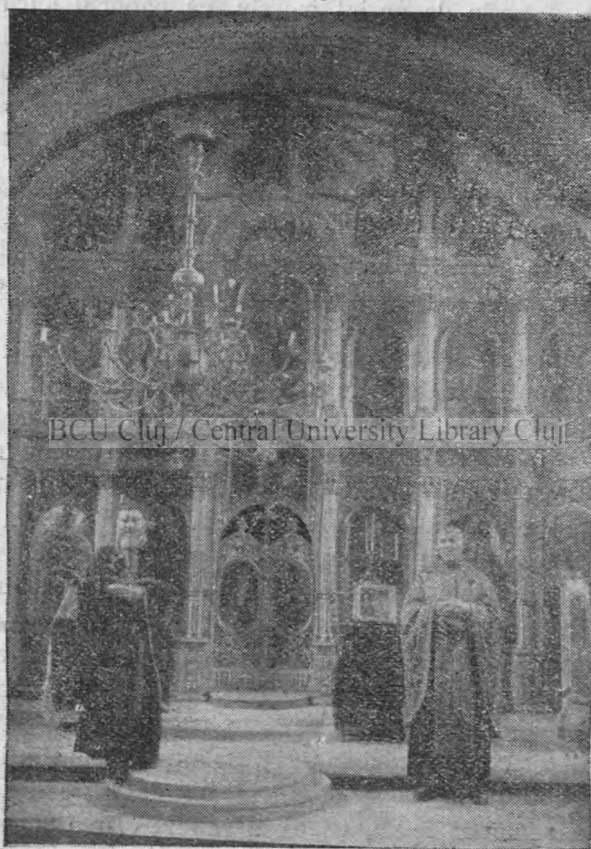
Iconostasul (tâmpla) bisericii ortodoxe-române.

Altarul pardosit, ca și restul bisericii, cu pătrate albe de piatră «kehlheim» de Austria, este mai înălțat cu o treaptă ca soleea și cu două ca naia bărbaților. Treptele sunt din piatră de gresie sclivizită.