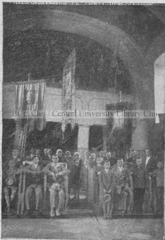
Pronaosul bisericii ort. române