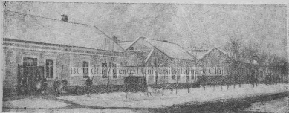
Vedere din strada principală, iarna.

Cumcă acesta a fost unul, dar nu singurul, din motivele emigrării, ne mai adeverește și nota din «Octoihosul» tipărit în Râmnic la 1706, în care se pomenește de apă și plouă mai în tot decursul anului 1719. Locul pe care s'a întemeiat noua