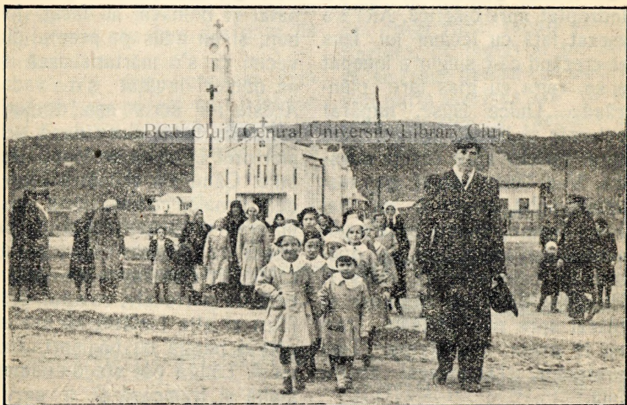
Copiii dela Căminul „Sf. Francisc” din Cluj, ieșind dela Biserică