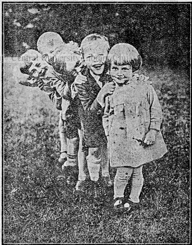
A sosit Primăvara și cu ea „Vieța Copiilor“

Vrem să facem această revistă ca să vă placă mai mult ca oricare alta, deaceia voi să o iubiți să o citiți și răspândiți.