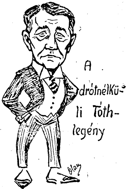
A drámai előadások lelke s a magyar színművészet egyik komoly büszkesége