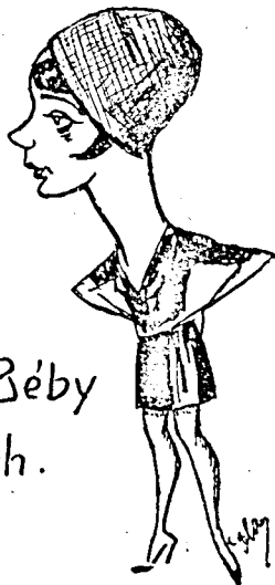
Ez a Béby betegh.

— Ihász? Rendez és tanít. Van külön sziniiskolája. Nővendék létszám: 10. Többnyire mind tehetségesek. Még egy-kettőt talán felvesz. Krónikás.