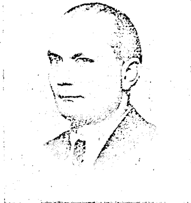
Dr. gróf BETHLEN LÁSZLÓ

kiállítási helységben foglaltak el előkelő helyet. A két központi tejfeldolgozó telep bemutatja az angliai és palesztinai export-vajat, valamint a falusi tejszövetkezetek üzemi berendezését és a modern tejfeldolgozás menetét. Nagy fényképgyűjteményben láthattuk itt a falusi tejszövetkezetek házait és üzemeit, la-