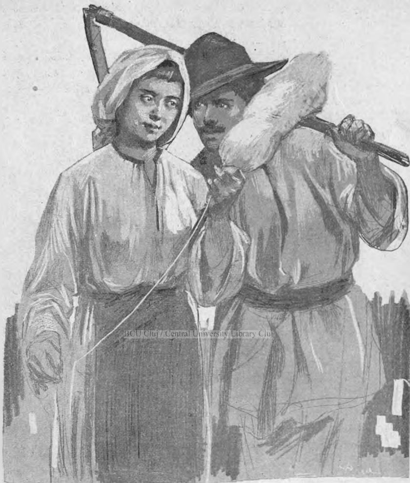
Desen de d. D. STOLICA.